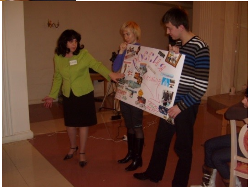
Фото 5. Презентация группы демократов