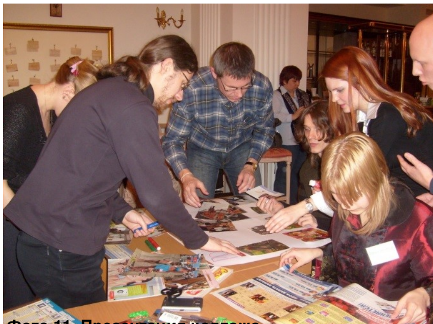
Фото 11. Презентация колледжа