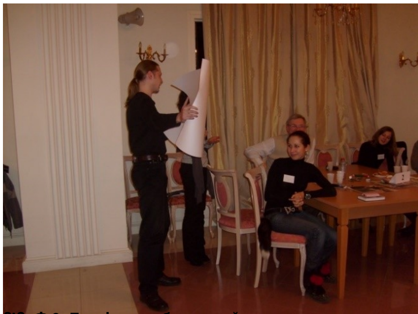
18. Фото создания коллажной повести