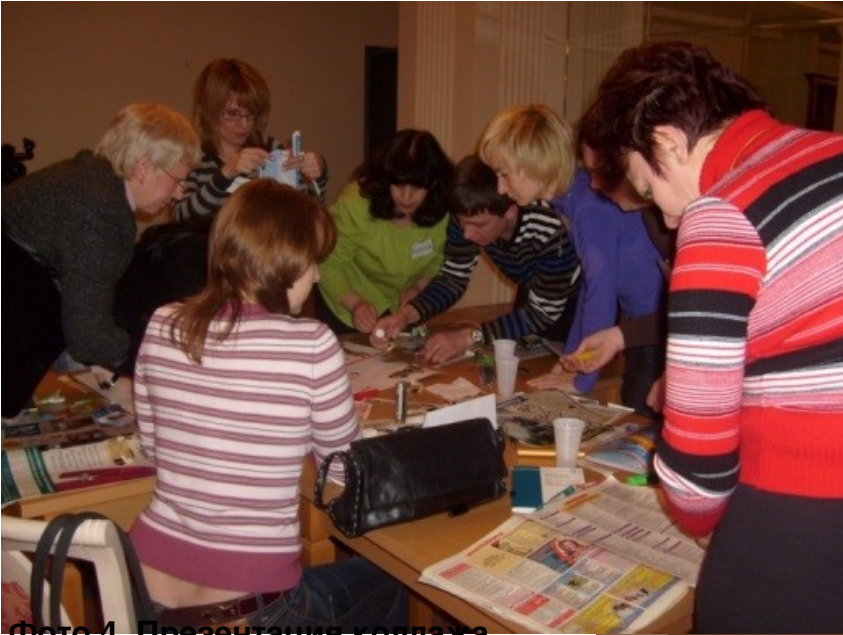
Фото 4. Презентация коллажа