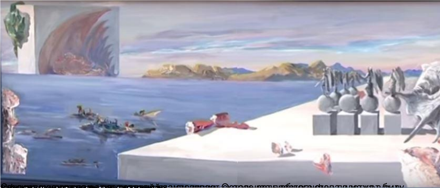
Самое сложное в картине - это пейзаж, который