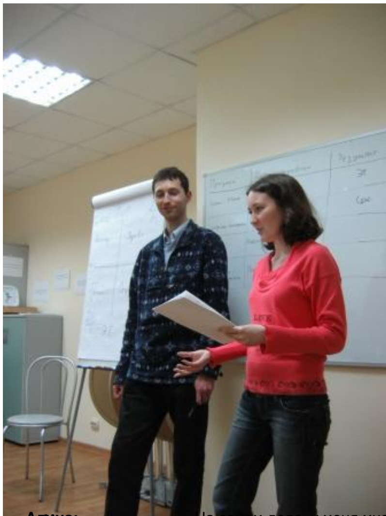
Алиши преподаватели дали мне много идей для тренинга (ваши отзывы и комментарии)